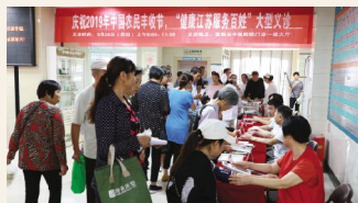
▲9月26日,医院开展“健康江苏服务百姓”义诊活动。