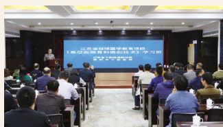
▲10月27日,骨伤科成功举办江苏省继续医学教育项目《基层医院骨科微创技术》学习班。