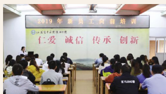
▲10月8日至16日,人事科组织2019年新进员工开展岗前培训。