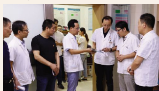
▲9月30日,医院开展节前安全大检查。