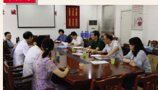
▲9月4日,江苏省中医药管理局组织“全国基层中医药工作先进单位”复评专家组来院检查工作。