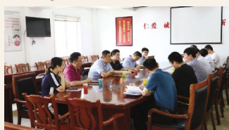
▲9月10日,常州市卫健委组织专家来院进行消防安全检查。