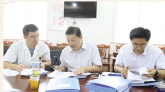
▲9月30日,常州市卫计委中医师组织专家来院进行中医教项目考核。