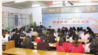
▲10月15日,人事科组织新职工开展系统化岗前培训。