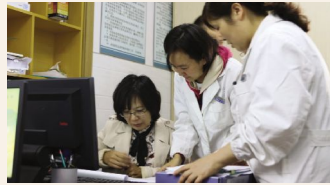
▲10月17日,江苏省疾控中心组织专家来院开展死亡监测、肿瘤报告登记交叉互查督导。